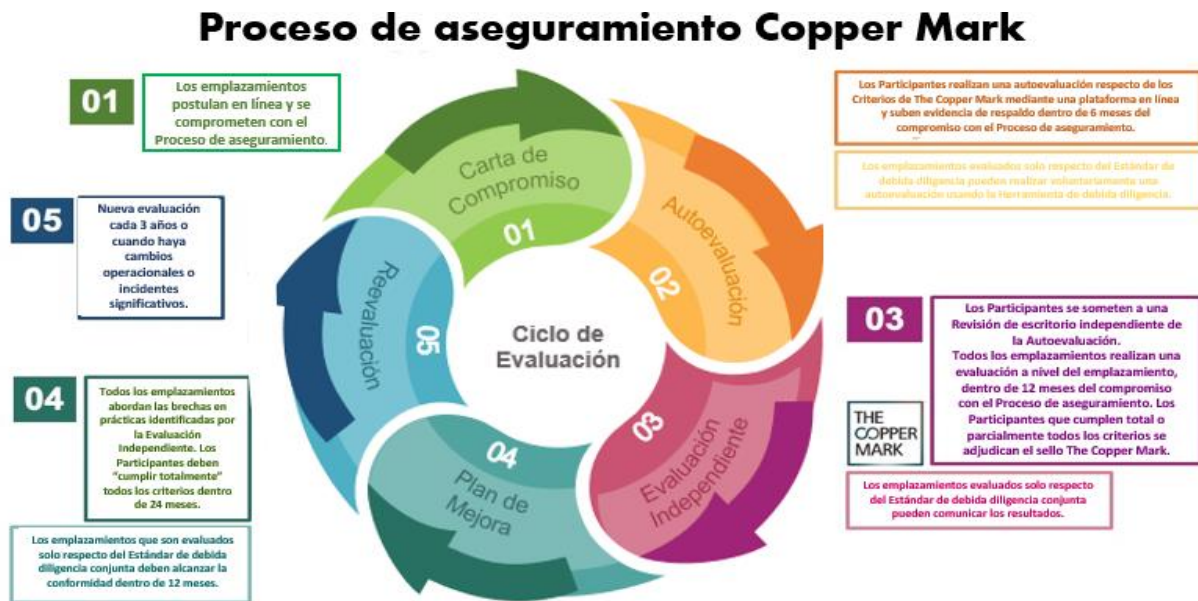
Figura 4: Cronograma del Proceso de aseguramiento Copper Mark