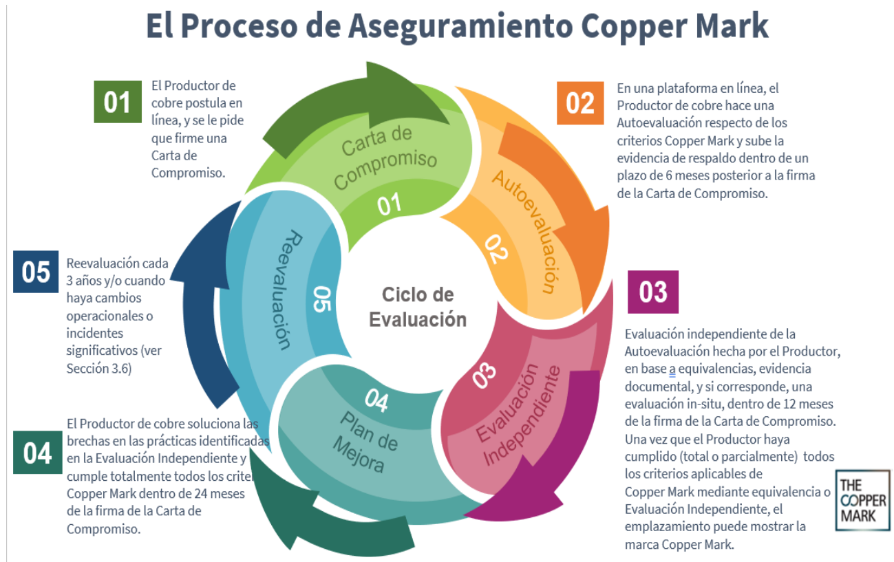
Figura 1: Esquema del Proceso de Aseguramiento Copper Mark