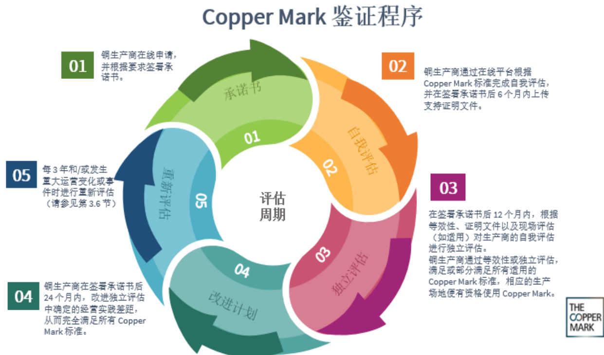
图 1: Copper Mark 鉴证程序周期概述